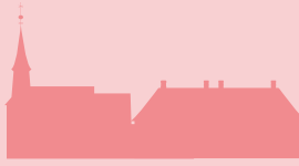
Lepramuseet, St. Jørgens Hospital El Museo de la Lepra, Hospital St. Jørgen