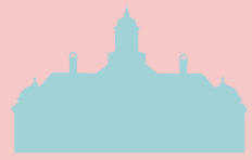
Damsgård Hovedgård Manoir de Damsgård