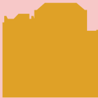
Bryggens Museum Musée de Bryggen