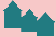
Gamle Bergen Museum Eski Bergen