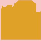
Bryggens Museum Bryggen Müzesi