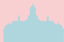
Damsgård Hovedgård МАЄТОК ДАМСГОРД