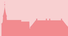
Lepramuseet, St. Jørgens Hospital МУЗЕЙ ПРОКАЗИ, ЛИКАРНЯ СВЯТОГО ЙОРГЕНА