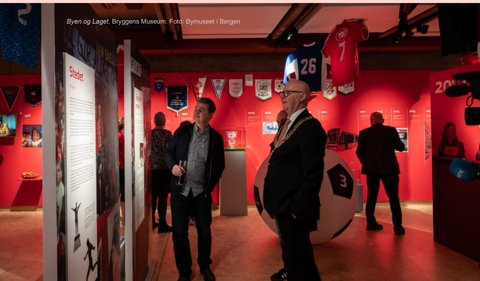
Byen og Laget, Bryggens Museum.

Bymuseet ønsket å vise historien til sportsklubben Brann som ble stiftet i 1908 og ikke minst sette klubben inn i en sammenheng med byens utvikling i moderne tid. For Bymuseet er det viktig å formidle historier som skaper entusiasme og som er relevant for ulike mennesker i dag. Bergen er lidenskap og identitet slik som Sportsklubben Brann er det. Dette ga oss også anledning til å vise at idrett er en viktig del av det moderne kulturbegrepet, vist på et av de mest sentrale kulturhistoriske museene i Bergen, Bryggens Museum. Utstillingen har engasjert publikum som normalt ikke går på museum.