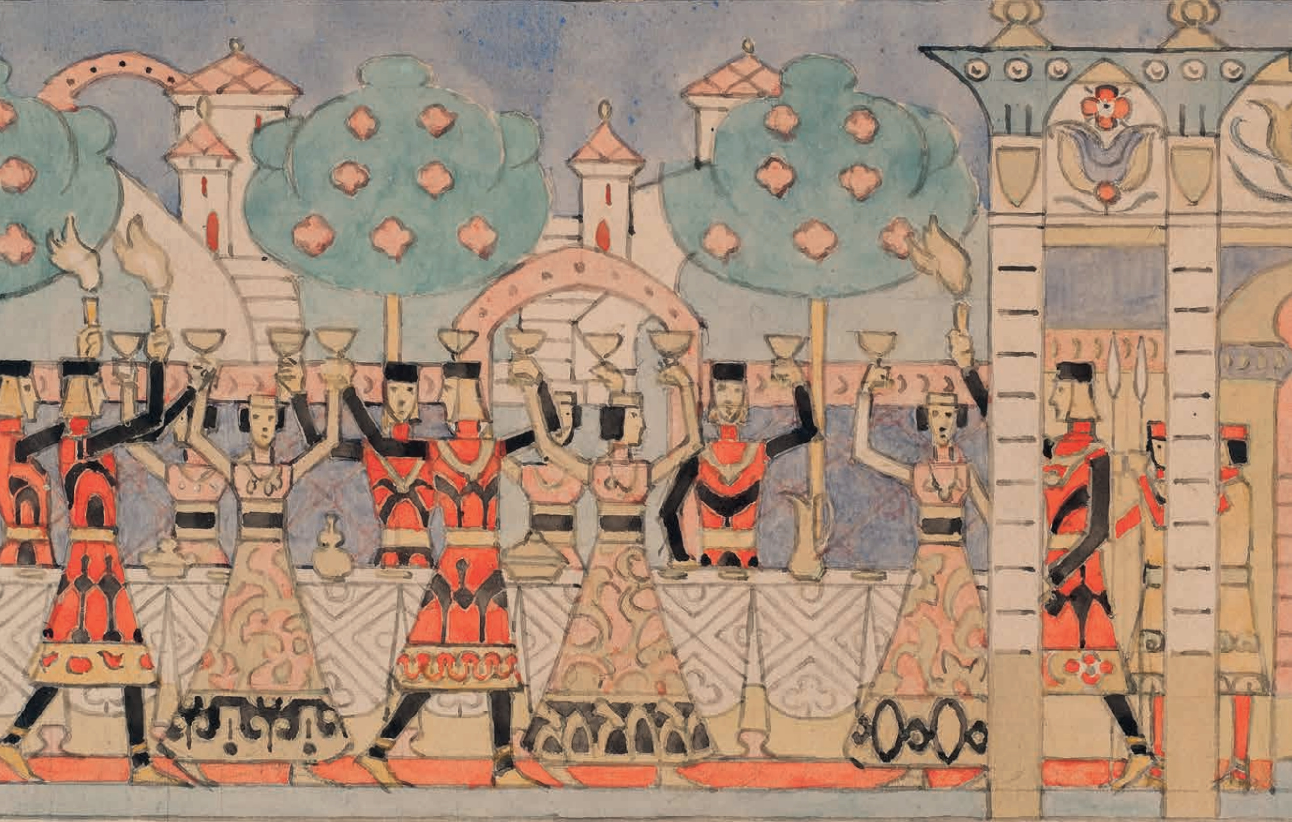
Bryllupet, Gerhard Munthe, 1905.