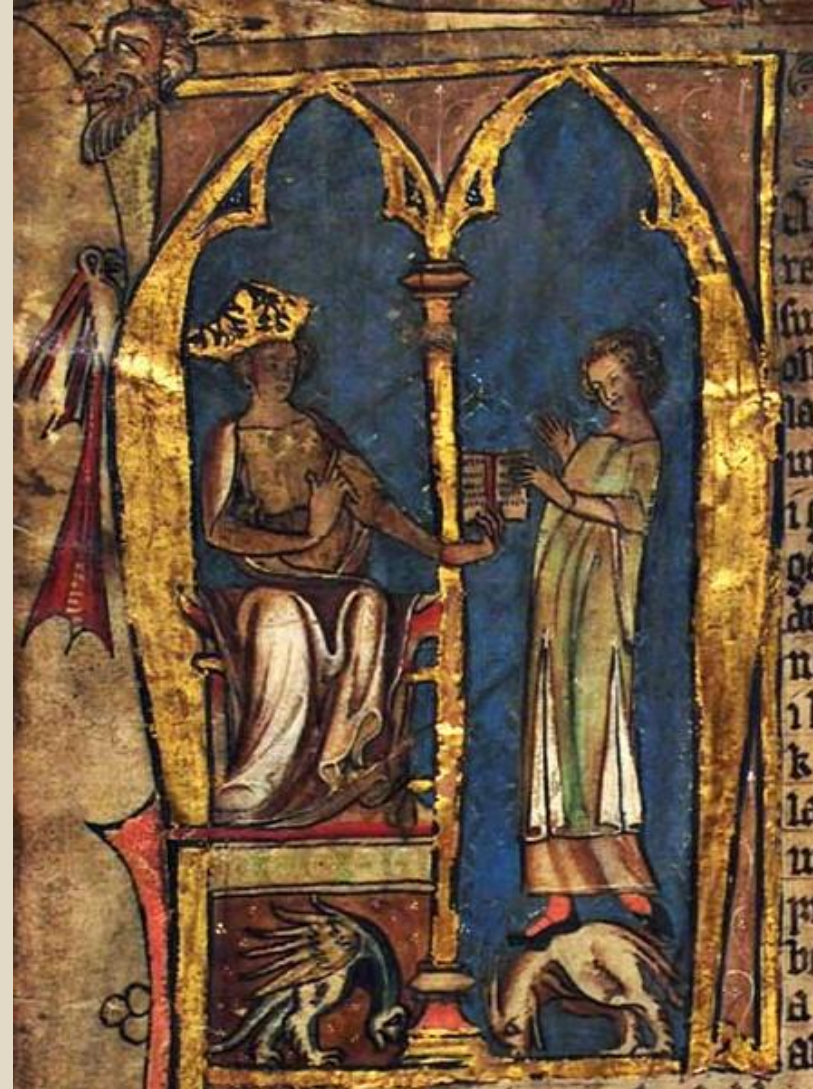
Bokmaleri fra en håndskrift av Landsloven. Utsmykket første bokstav (Initial) i fortalen til landsloven.

Ættehevn var den siste konfliktkilden. Her fantes det et forbilde i kirkelig rett. Den kanoniske loven sa at hvert individ var ansvarlig for sine handlinger foran gud. Slekten kunne ikke påta seg ansvaret. Etter dette forbilde ble også enkeltpersonens ansvar forankret i loven. Dermed ble ættehevnen avskaffet. Ansvar for å straffe ble overført til tinget.