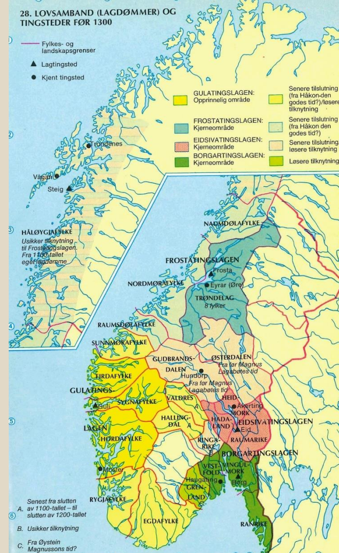
Norges Historie , Bd 15 Historisk Atlas, Kart 28.

På tinget ble man enig om felles politiske beslutninger, og det kan derfor kalles et kollektivt styringsorgan. Beslutningene kunne handle om å løse en konflikt eller avgjøre andre spørsmål som angikk felleskapet. Noen avgjørelser gjaldt konkrete spørsmål, mens andre var mer generelle og kunne bli til regler eller lover. Tinget hadde dermed lovgivende makt.