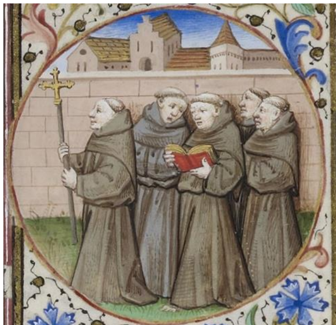
Bildet viser fransiskanermunker i en prosesjon i sine typiske grå drakter.

Frans var sønn av en rik italiensk kjøpmann som valgte et liv i frivillig fattigdom. Hans omsorg for de fattige inspirerte mange andre og førte til grunnleggelsen av ordenen.