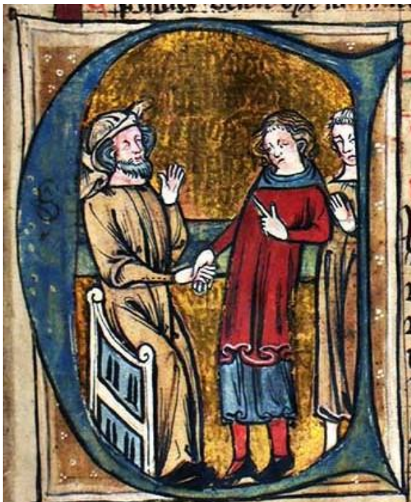
Inngåelse av en avtale. Avtalen er muntlig med et vitne (i bakgrunnen). Bokmaleri fra en håndskrift av Landsloven. Det Kgl. Bibliotek, GKS 1154 folio, bl. 35 R.

sitt ting i Norge som f.eks. Gulating, Frostating, Borgarting Eidsivating.