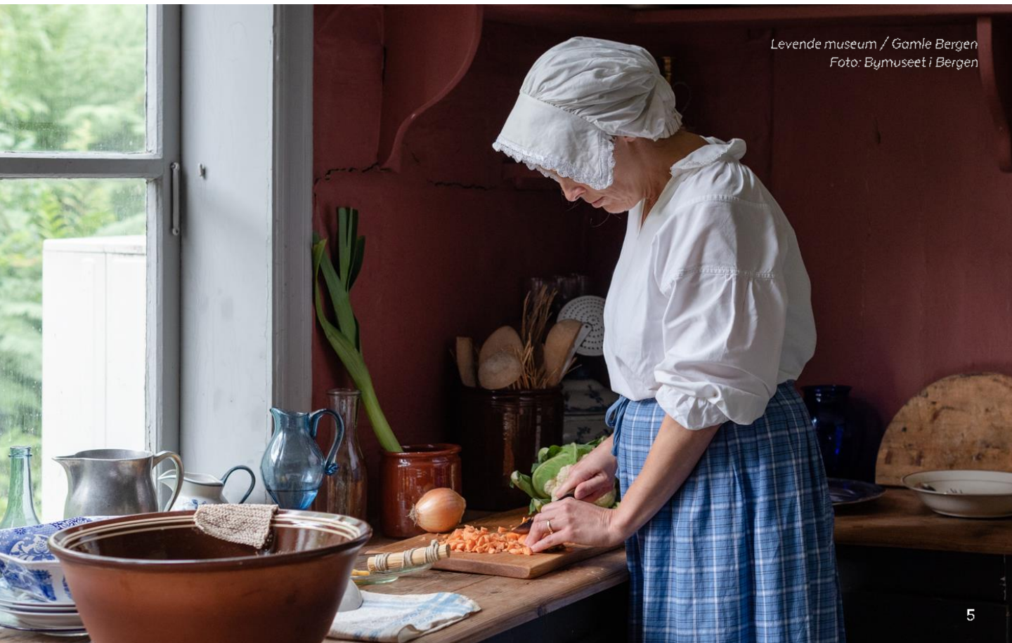
Levende museum / Gamle Bergen