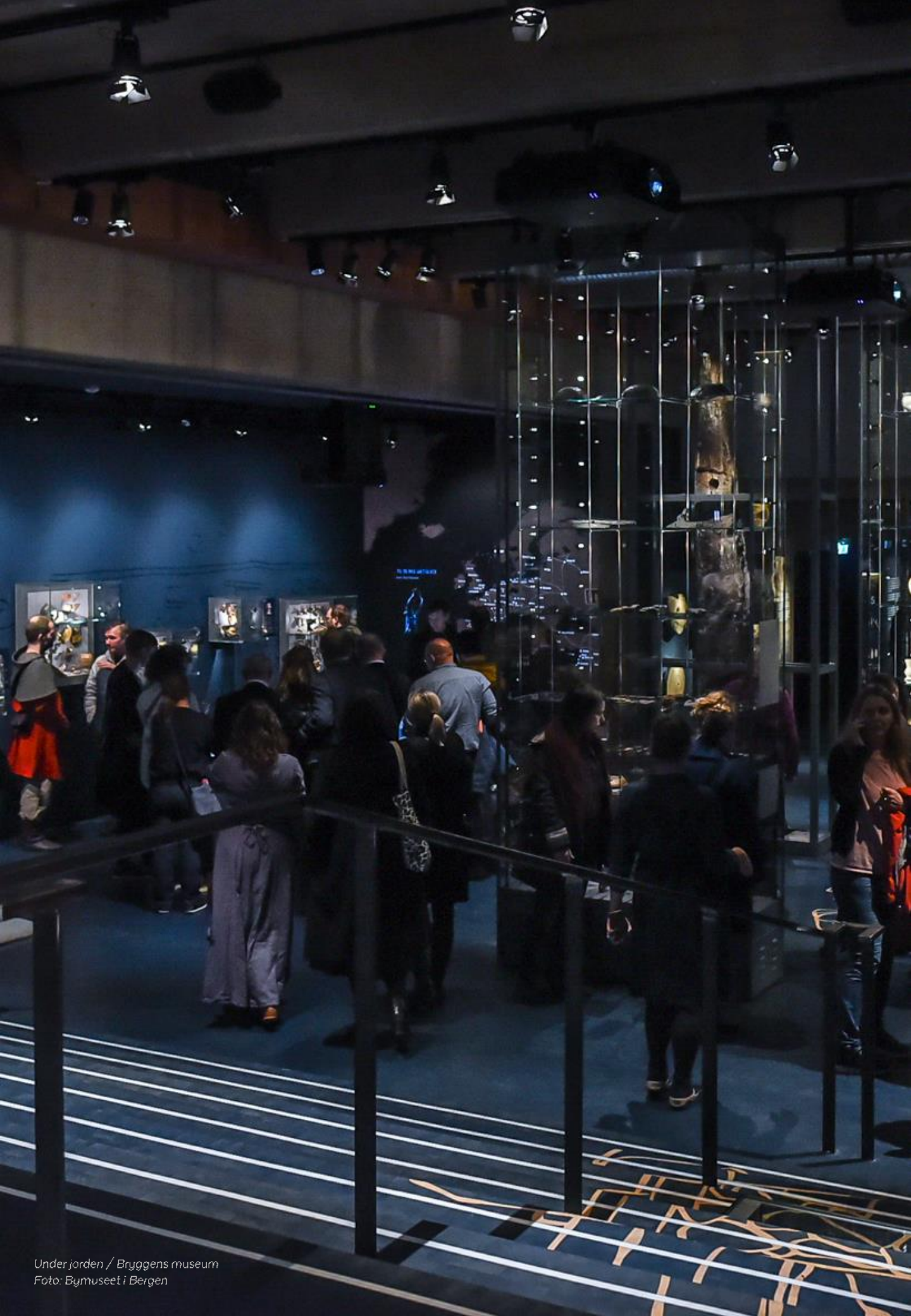
Under jorden / Bryggens museum