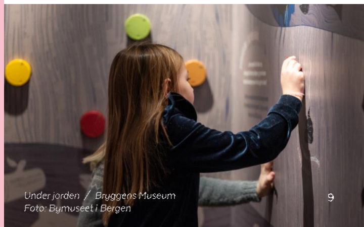
Under jorden / Bryggens Museum