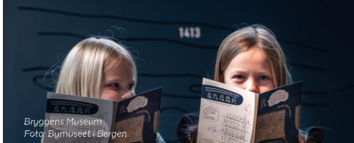
Bryggens Museum

Opplev fortiden. Forstå nåtiden. For en bedre fremtid.