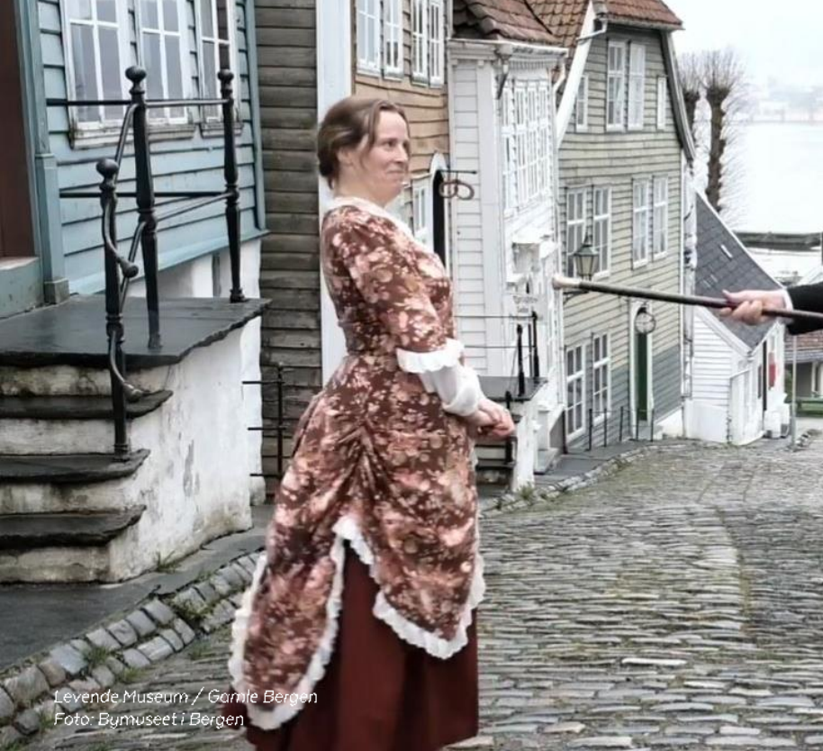
Levende Museum / Gamle Bergen