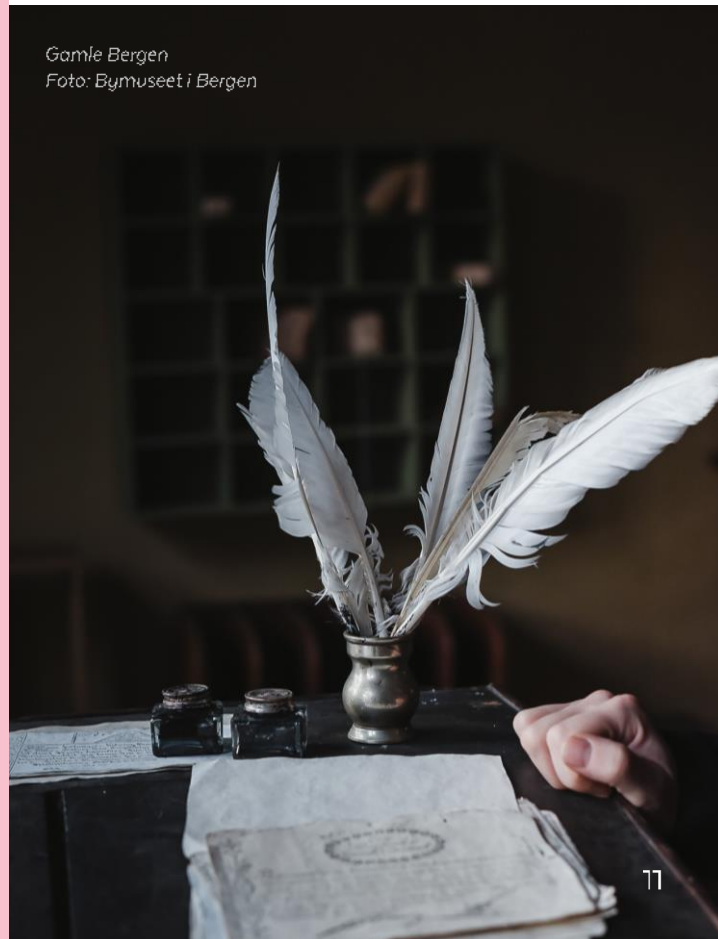
Gamle Bergen