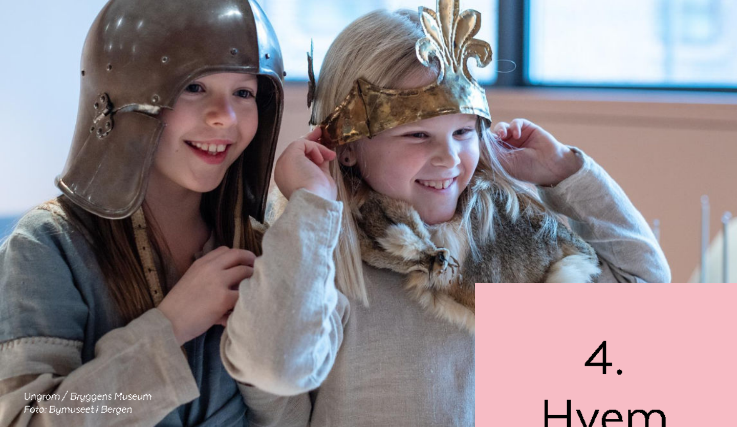
Ungrom / Bryggens Museum Foto: Bymuseet i Bergen